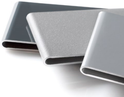
[heroal Oberfläche Glanzgrade.jpg]

Architektur gestalten: Dank harmonisch miteinander kombinierbarer Aluminium-Systemlösungen in höchster Design- und Farbvielfalt lassen sich einzigartige architektonische Entwürfe verwirklichen.