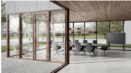
[heroal 06 Fassade Fenstertür heroal SD Rost_C 50, W 72_A4.jpg]

Architektur gestalten: Dank harmonisch miteinander kombinierbarer Aluminium-Systemlösungen in höchster Design- und Farbvielfalt lassen sich einzigartige architektonische Entwürfe verwirklichen.