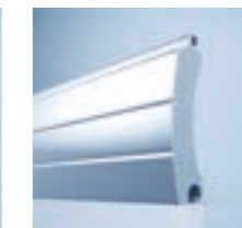
heroal RD 75 TL

Aan u de keuze: zicht, tralie- of ventilatieprofielen zorgen voor een betere ventilatie, grotere lichtinval en extra stabiliteit. Voor een vlak oppervlak heeft u de keuze uit de puristische lamel heroal RD 75 met moderne look zonder inkepingen of de heroal RD 75 TL Trend Lines in roldeurenoptiek met inkepingen. Voor een smal afdekbereik kunt u kiezen voor de lamel heroal RD 55 .