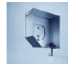
heroal GKSE 230

Aan u de keuze: zicht, tralie- of ventilatieprofielen zorgen voor een betere ventilatie, grotere lichtinval en extra stabiliteit. Voor een vlak oppervlak heeft u de keuze uit de puristische lamel heroal RD 75 met moderne look zonder inkepingen of de heroal RD 75 TL Trend Lines in roldeurenoptiek met inkepingen. Voor een smal afdekbereik kunt u kiezen voor de lamel heroal RD 55 .