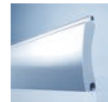
heroal RD 75