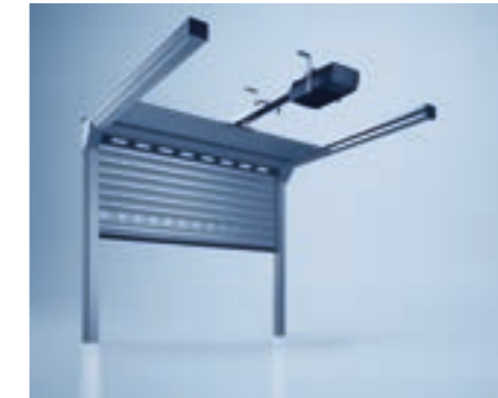
heroal plafondroldeur met middenaandrijving

Bij garages met een kleine lateihoogte, is de plafondroldeur heroal OD 75 het product van uw keuze. Bij het openen worden de lamellen niet in de afdekkast opgerold, maar plat onder het plafond. Al naar gelang de inbouwsituatie kan in kleine garages met een lage latei een plaatsbesparende zijaandrijving of in garages met een opening tot 4 x 4 meter een middenaandrijving worden gemonteerd.