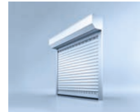
Roldeur heroal RD 75 met gesloten montage

De roldeur heroal RD 55 is geschikt voor kleine tot middelgrote garageopeningen – de uitvoering met meer ontwerp- en uitrustingsmogelijkheden, de heroal RD 75, ook voor garageopeningen tot 6 meter breed . Beide systemen kunnen zowel open (om ruimte te besparen), als gesloten met afdekkast worden gemonteerd. Deze kan zowel aan de binnen- als aan de buitenzijde worden aangebracht.