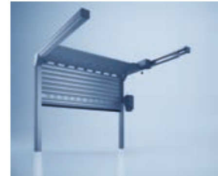
heroal plafondroldeur met zijaandrijving