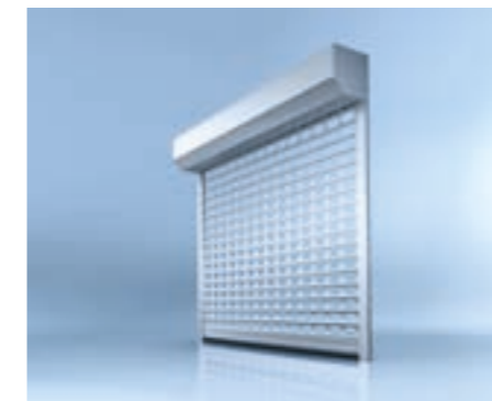
heroal roldeur met rolhek

De roldeur heroal RD 55 is geschikt voor kleine tot middelgrote garageopeningen – de uitvoering met meer ontwerp- en uitrustingsmogelijkheden, de heroal RD 75, ook voor garageopeningen tot 6 meter breed . Beide systemen kunnen zowel open (om ruimte te besparen), als gesloten met afdekkast worden gemonteerd. Deze kan zowel aan de binnen- als aan de buitenzijde worden aangebracht.