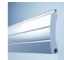
heroal RD 75 TL