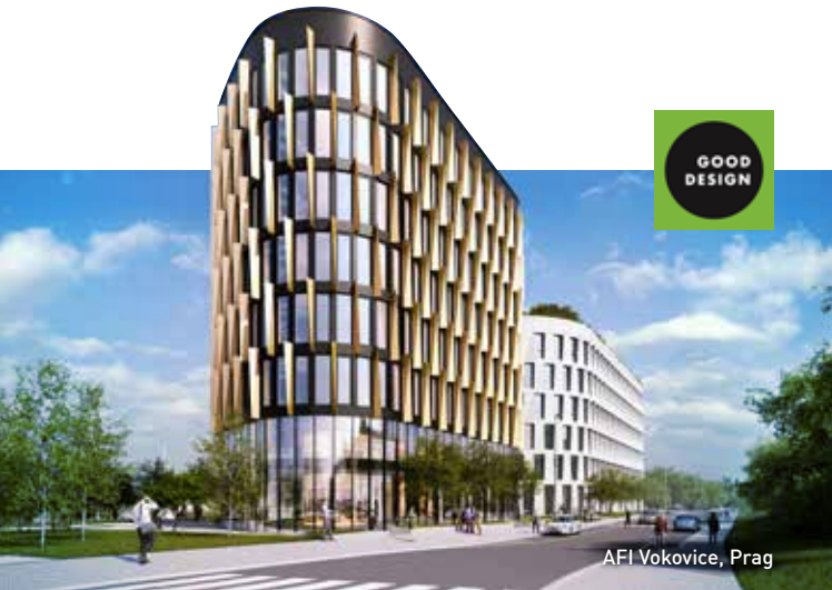
AFI Vokovice, Prag

heroal Lösungen machen das Energiesparen leichter, das Bauen sicherer und leisten einen wertvollen Beitrag zur Nachhaltigkeit von Gebäuden. Dies demonstrieren zwei Objekte, die aus diesem Grund mit unseren Systemen realisiert wurden.