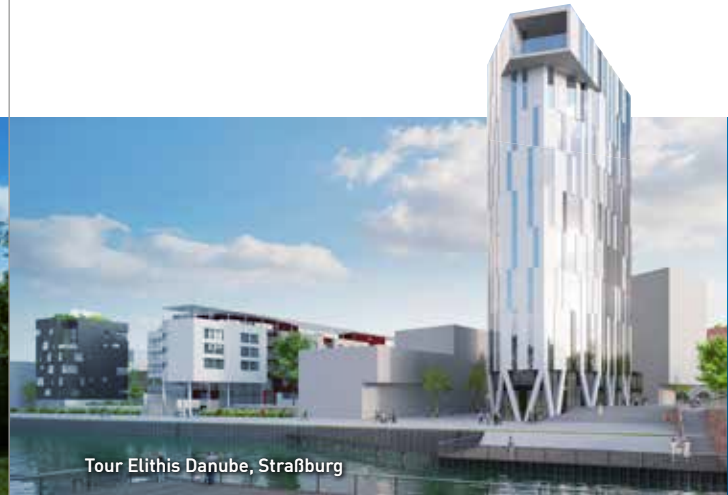
Tour Elithis Danube, Straßburg