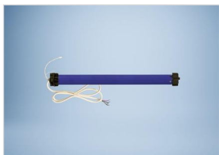
[heroal Connect R TM]

Das Unterputzmodul heroal Connect RS zur smarten Steuerung von Rollläden und Sonnenschutz verschwindet unsichtbar hinter vorhandenen Wandschaltern/-tastern.