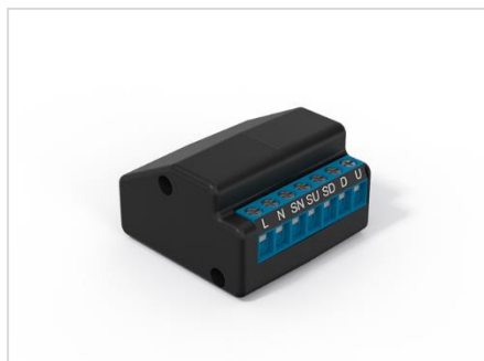
[heroal Connect RS_WLAN-Modul]

Mit dem Smart Home System heroal Connect lassen sich Rollläden und Sonnenschutz intelligent und komfortabel steuern – ob zu Hause oder unterwegs.