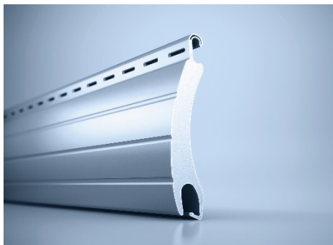
[heroal RS 55 SL Rollladenstab]

Für vorkonfektionierte heroal Ready Fertigelemente im Bereich der Vorbaurollläden stehen ab sofort weitere Stabvarianten zur Verfügung: neu hinzugekommen sind die Rollladenstäbe heroal RS 38 und heroal RS 42 sowie der Sicherheitsrollladenstab heroal RS 55 SL (siehe Bild).