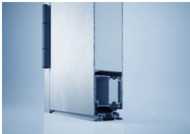
[heroal D 72 mit heroal SD]

Mit heroal SD beschichtetes Haustürsystem heroal D 72.