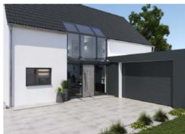
[heroal Surface Design]

Die Haustür in Betonoptik passt optimal zu den übrigen Elementen der Gebäudehülle.