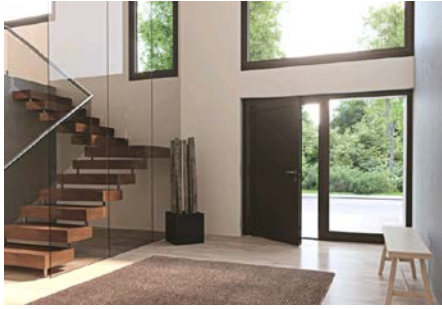
[heroal_Architektenhaus_Le Corbusier_Haustür_Milieu innen]

Durch die exklusive Partnerschaft mit Les Couleurs® Le Corbusier bietet heroal das hochwertige Farbspektrum auch für Fenster, Fassaden, Rollläden, Rolltore und Sonnenschutz an.