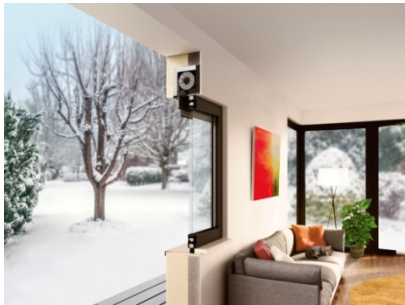
[Querschnitt heroal IB Unique + heroal W 77]

Dank unterschiedlicher Kastengrößen, Revisionsarten und Integrationsmöglichkeiten verschiedener Beschattungssysteme bietet heroal IB Unique Planern und Verarbeitern einen großen Gestaltungsspielraum.