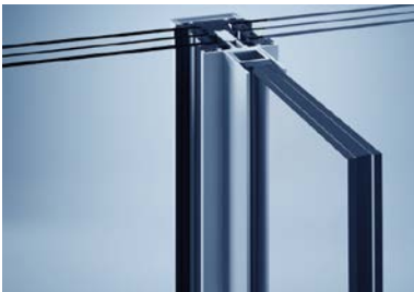
[heroal C 50 GD]