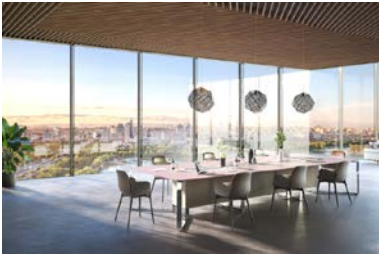
[heroal C 50 GD Milieu]

Das innovative Fassadensystem heroal C 50 GD kreiert dank des Glasschwerts maximale Transparenz.